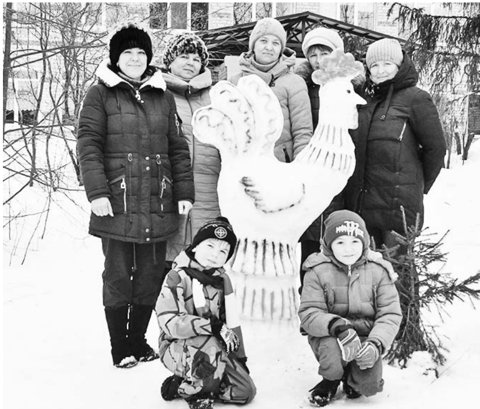
Одна из снежных фигур, сделанных командой Вертненской школы.